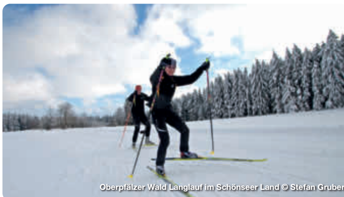
Oberpfälzer Wald Langlauf im Schönseer Land