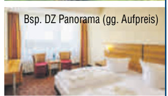
Bsp. DZ Panorama (gg. Aufpreis)