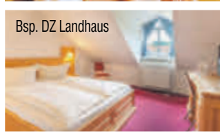
Bsp. DZ Landhaus